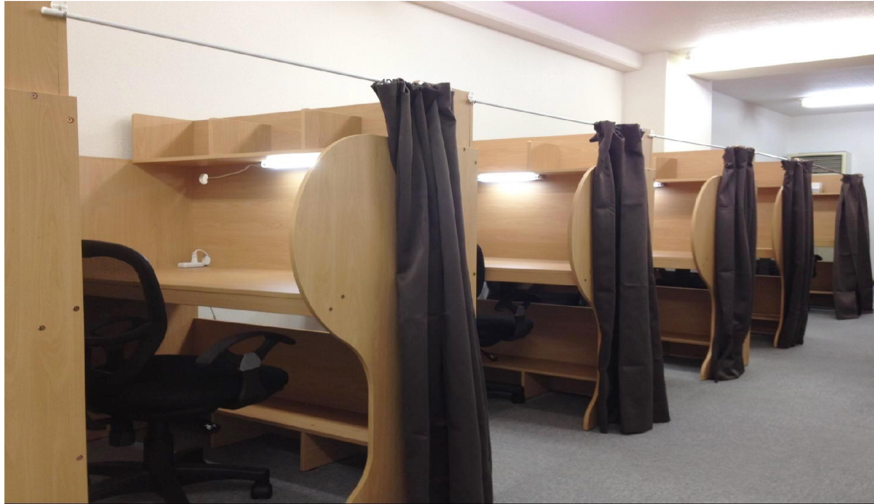
図) 春日部市 明光義塾 https://www.meikogijuku.jp/ より