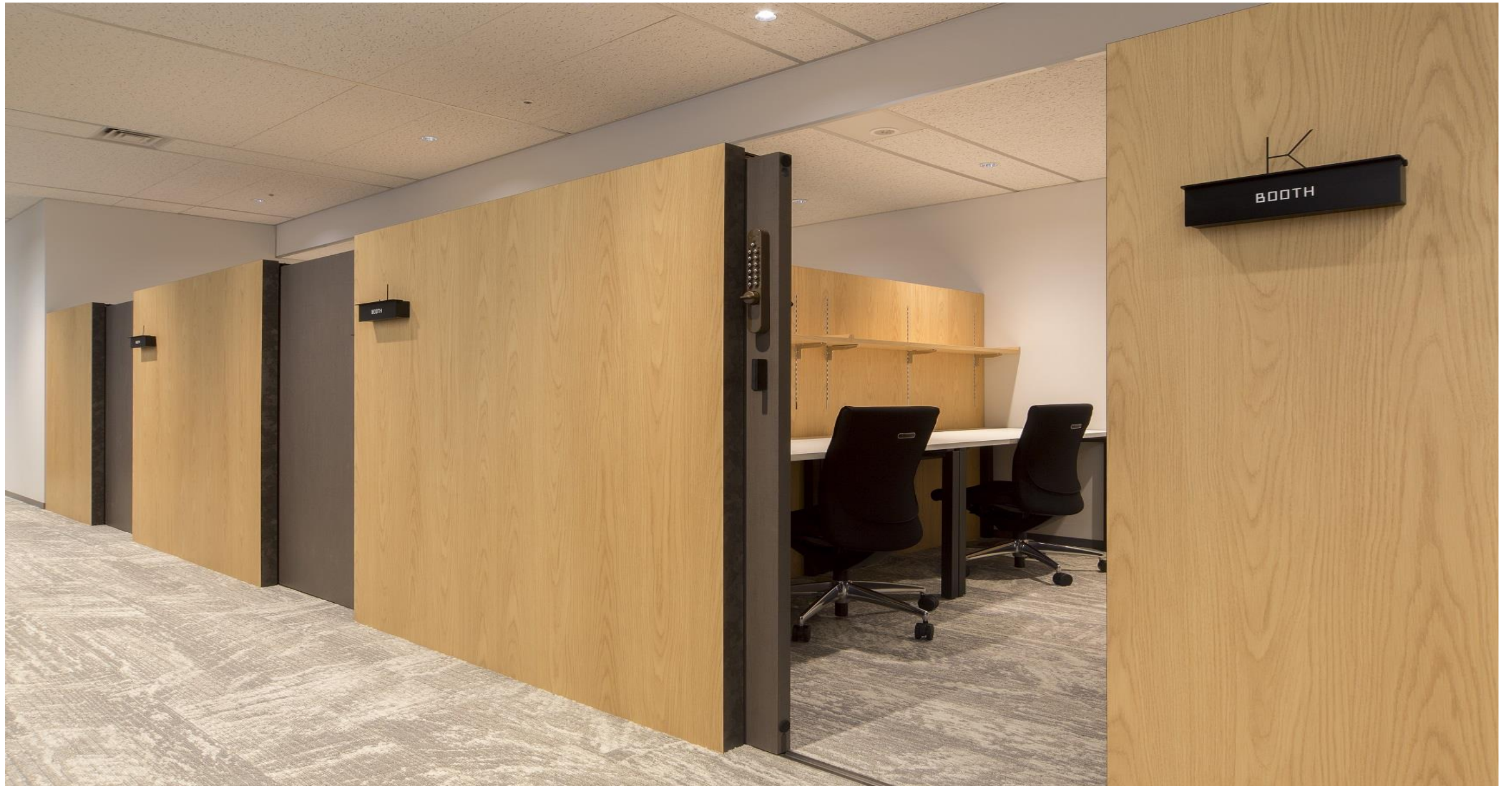
図) SENQ霞が関